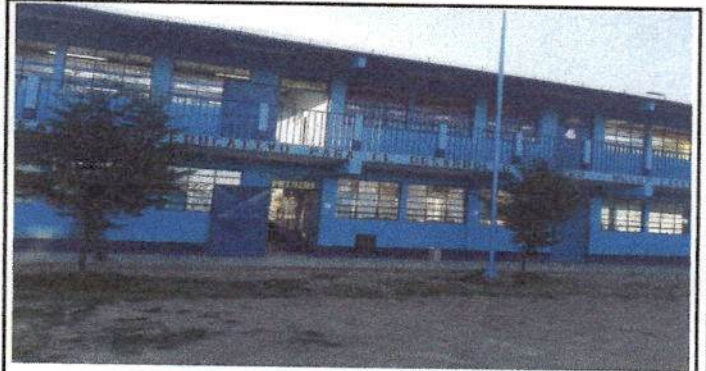
Foto 4: elaboración de balcones de metal en las ventanas en frente.